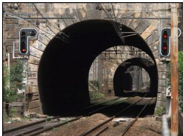
Et les galeries de Lormont 2 et 1