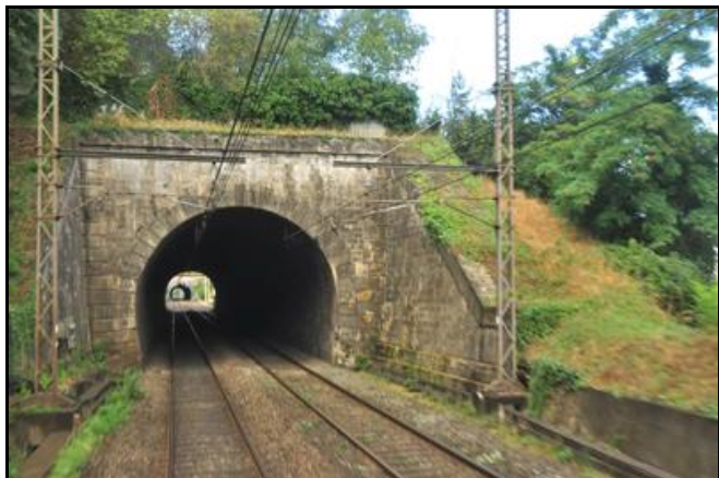
A l'arrière-plan, la galerie de Lormont 4