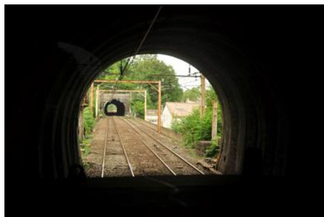
L'entrée et la sortie de la galerie de Lormont 3 avec : A gauche, la galerie de Lormont 2 A droite, la galerie de Lormont 4