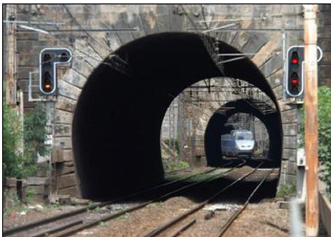
Un TGV sort de la galerie de Lormont 1 et s'apprête à entrer dans celle de Lormont 2