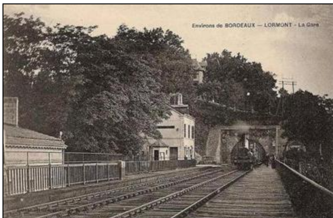
Un train sort de l'entrée du tunnel de Lormont 4 et arrive en gare de Lormont

Si cette fiche comporte des erreurs ou des oublis, merci de nous le signaler.