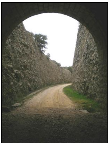
Ci-contre, l'entrée vue de l'intérieur