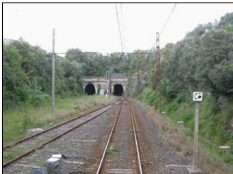
Les entrées des deux galeries de Faugères à la sortie de la gare du même nom