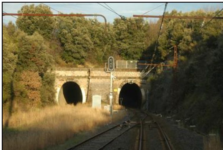
La galerie abandonnée de Faugères Nord est ici à gauche