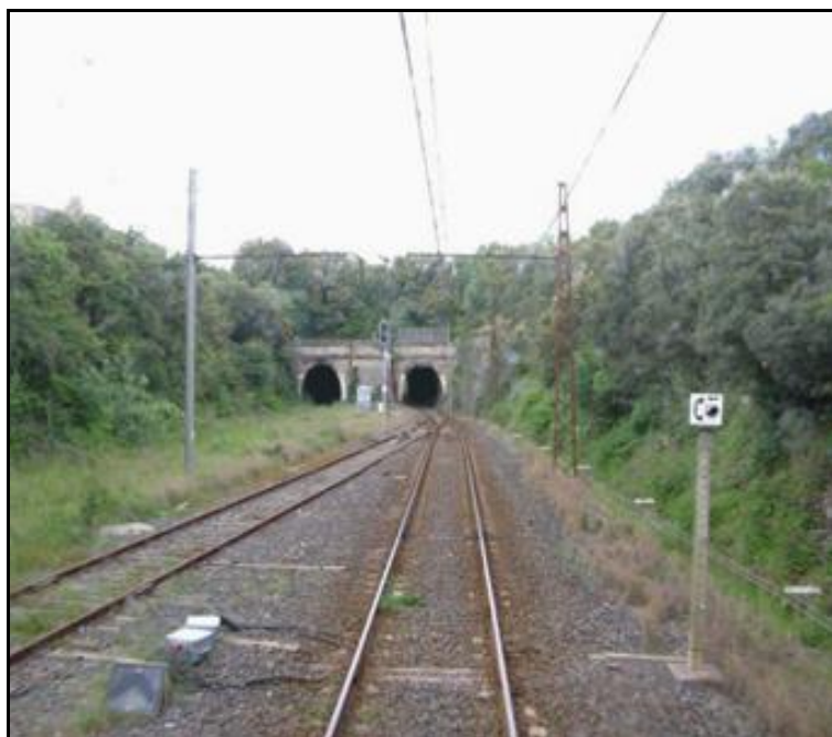
Les entrées des deux galeries de Faugères à la sortie de la gare du même nom