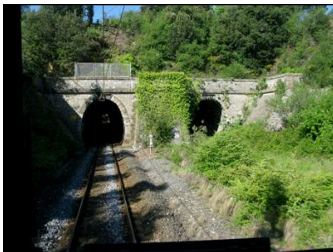
Les sorties des galeries

Si cette fiche comporte des erreurs ou des oublis, merci de nous le signaler.