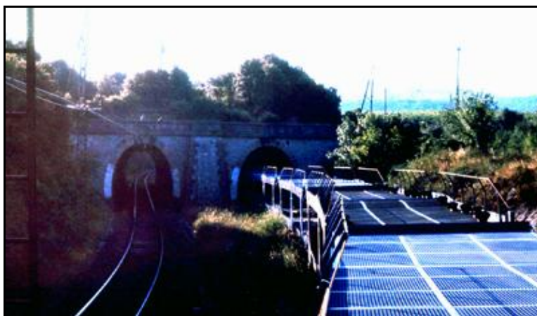
Photo ancienne montrant la sortie de la galerie et un train de wagons porte voitures garé sur l'ancienne ligne vers Pézenas pas encore défermée

La galerie de Bonne Eau Ouest est la galerie en service