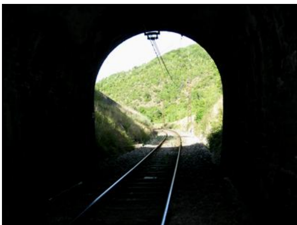
L'entrée vue de l'intérieur