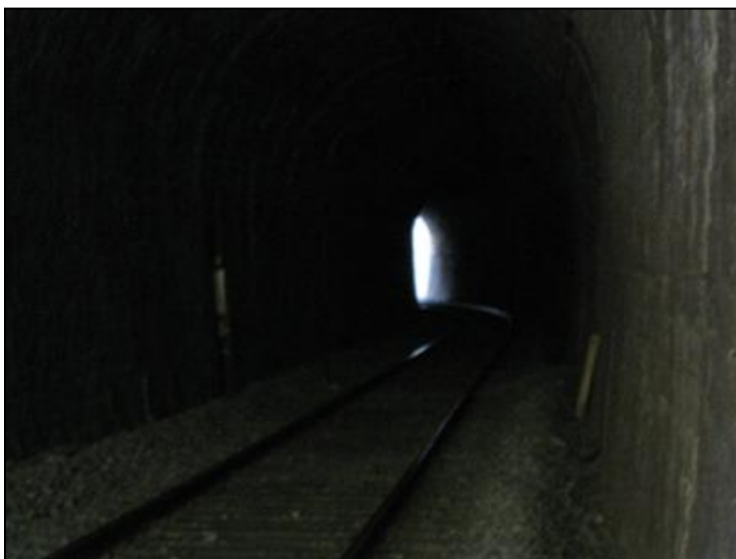
L'intérieur de la galerie

Si cette fiche comporte des erreurs ou des oublis, merci de nous le signaler.