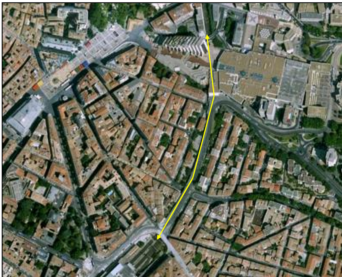
Vue aérienne de la galerie du Polygone

Si cette fiche comporte des erreurs ou des oublis, merci de nous le signaler.