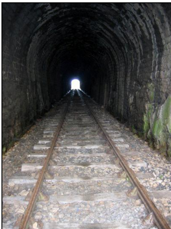
La galerie, peu de temps avant son déferrement

Si cette fiche comporte des erreurs ou des oublis, merci de nous le signaler.