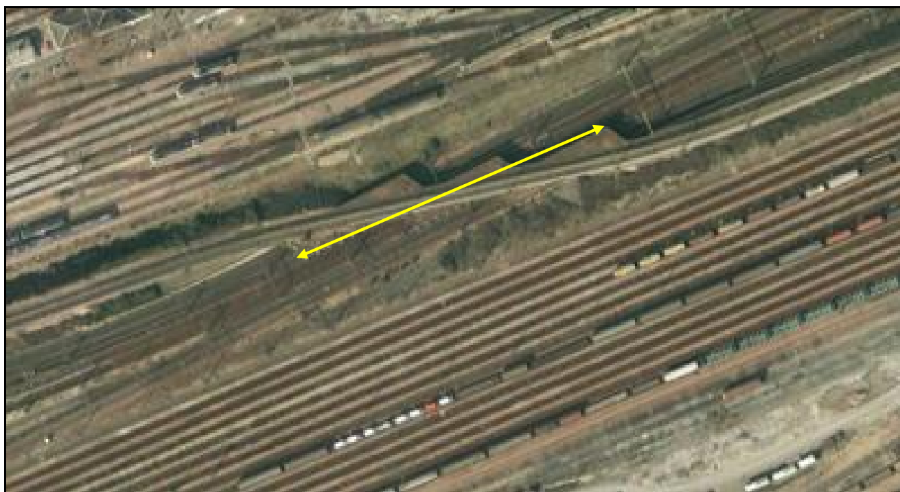
Ci-dessous, vue aérienne du saut de mouton

Si cette fiche comporte des erreurs ou des oublis, merci de nous le signaler.