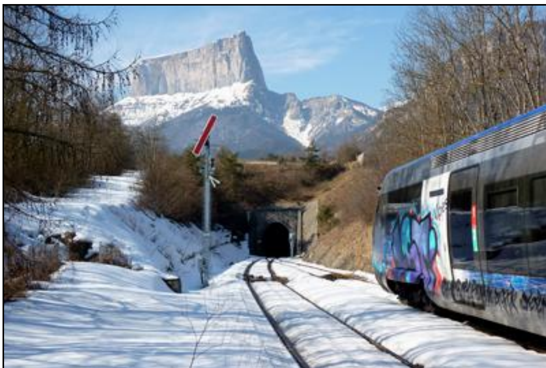
Avec le Mont Aiguille sous la neige, en ambiance hivernale

Si cette fiche comporte des erreurs ou des oublis, merci de nous le signaler.