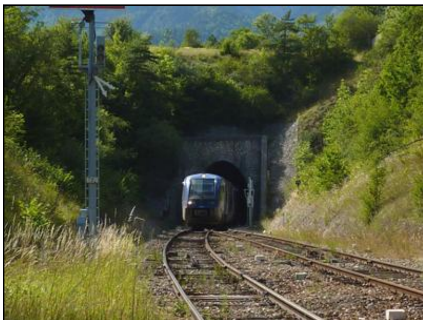
Ci-contre et ci-après, quatre photos de la sortie du tunnel