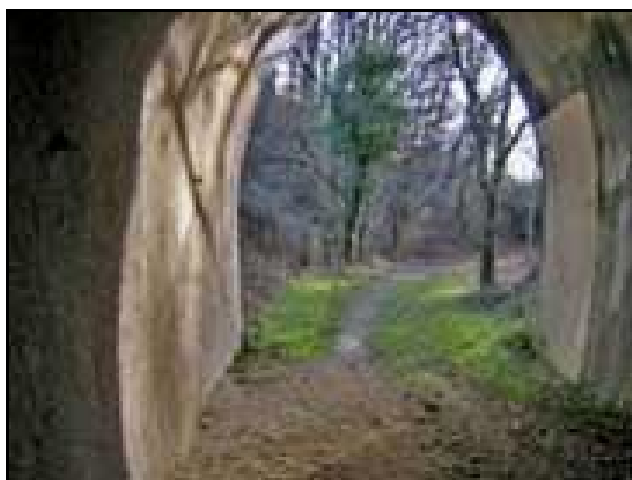
L'entrée du tunnel vue depuis l'intérieur de la galerie