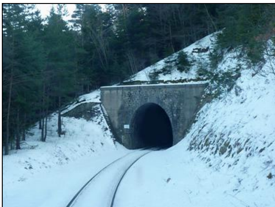
Le tunnel sous la neige