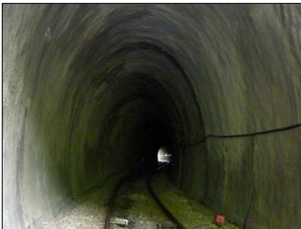
Cette photo révèle bien la double courbure en S de la galerie