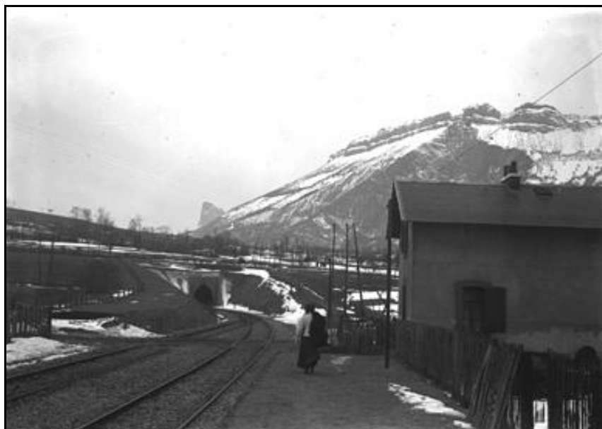
L'arrêt de Clermont Monestier et l'entrée du tunnel du col du Fau

Si cette fiche comporte des erreurs ou des oublis, merci de nous le signaler.