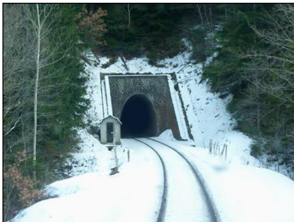
L'entrée du tunnel sous la neige