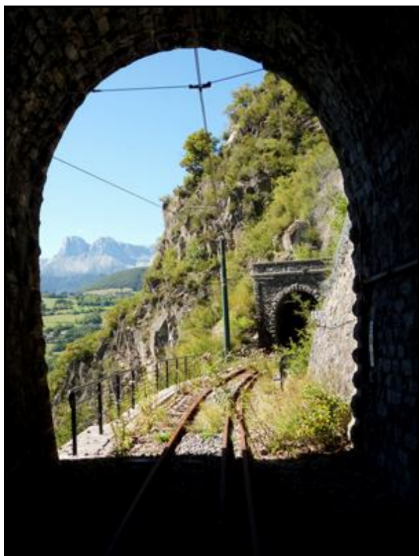
Ci-contre, l'entrée du tunnel vue de l'intérieur A l'arrière-plan la sortie du tunnel de Chalanches 1