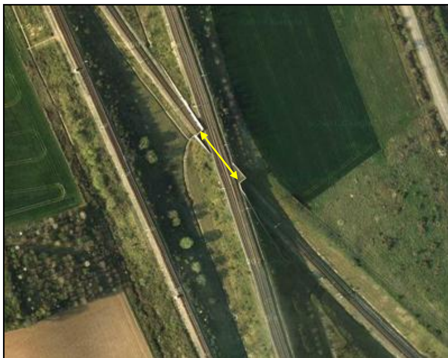
Vue aérienne de la galerie des Buyats

Quelqu'un a pris mon derrière. Qui prendra mon visage ?