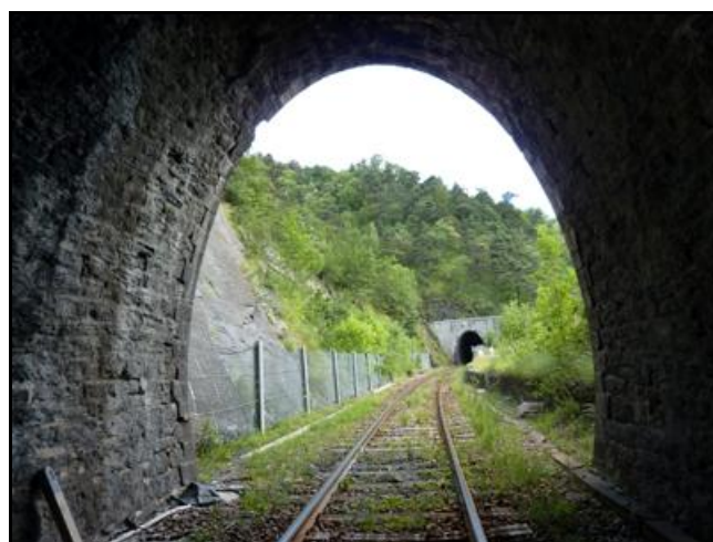
Au fond, l'entrée du tunnel de La Motte Sinard n° 2

Si cette fiche comporte des erreurs ou des oublis, merci de nous le signaler.