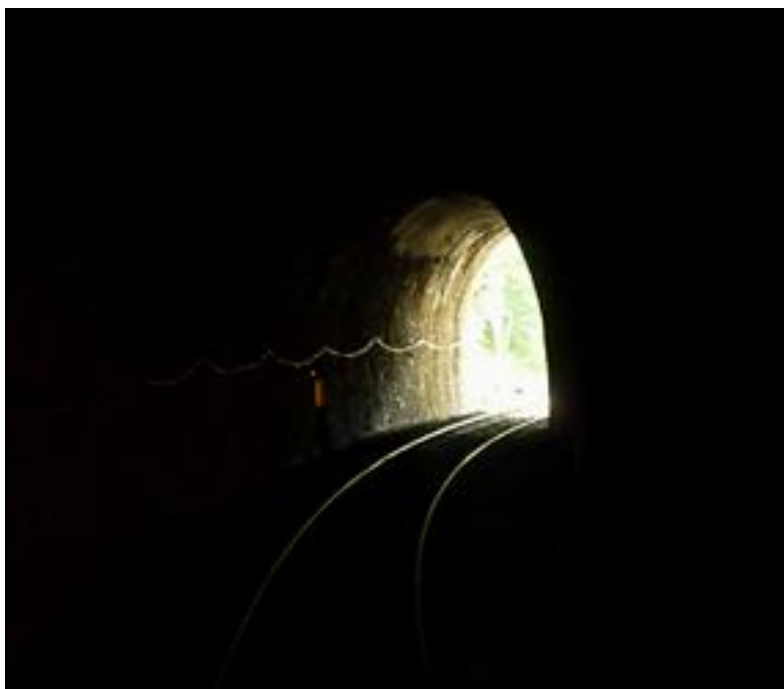
Dans la galerie

Si cette fiche comporte des erreurs ou des oublis, merci de nous le signaler.