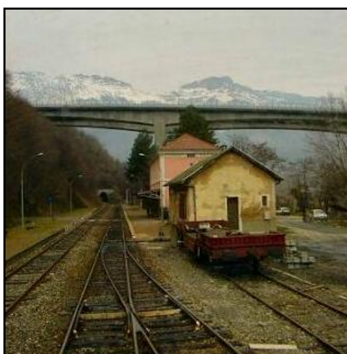
La gare de Vif et l'entrée du tunnel de la Rivoire

Quelqu'un a pris mon derrière. Qui prendra mon visage ?