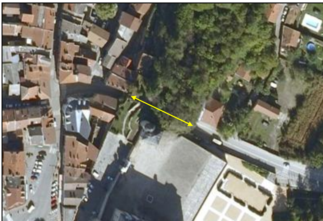
Vue aérienne du tunnel du château

Si cette fiche comporte des erreurs ou des oublis, merci de nous le signaler.