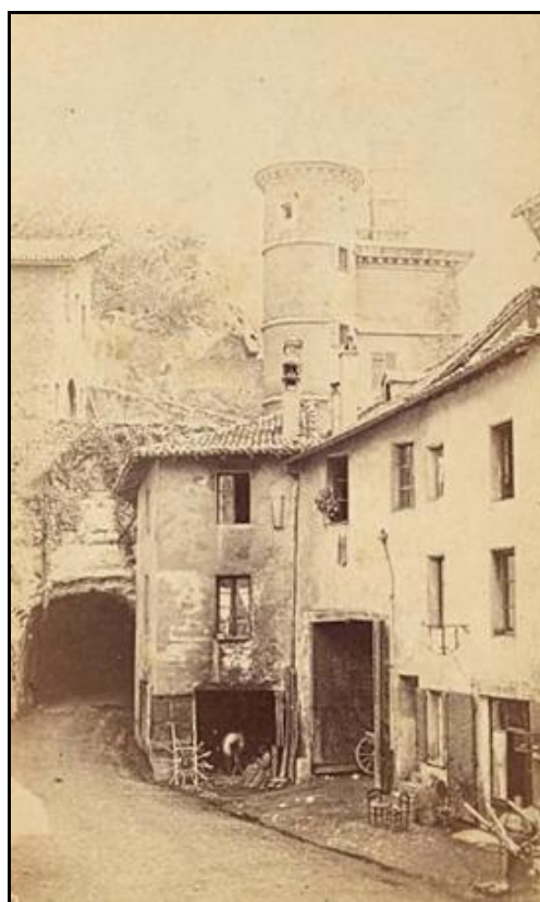
Deux vues de la sortie du tunnel : A gauche, avec la ligne de tramway A droite, avant construction de cette dernière