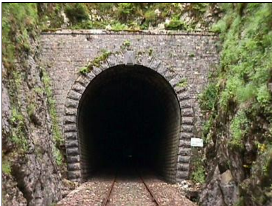
L'ancienne entrée du tunnel avant les travaux de réfection de 2009

Si cette fiche comporte des erreurs ou des oublis, merci de nous le signaler.