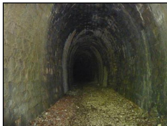
Divers aspects de la galerie en roche vive avec des anneaux maçonnés de renfort par endroits