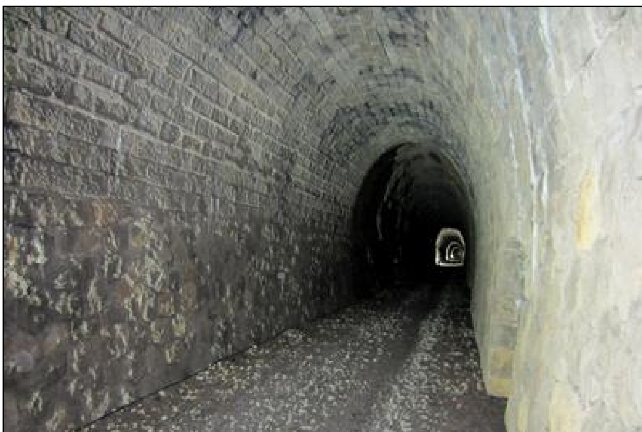
La galerie exceptionnellement éclairée pour une manifestation vététiste