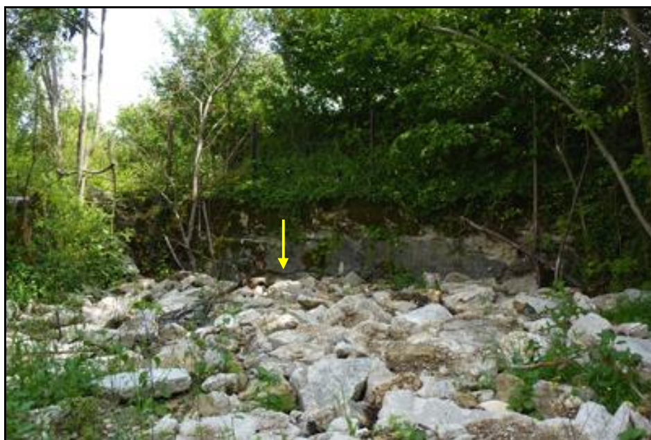
La tranchée comblée, le sommet du fronton en béton et l'orifice de sortie situé sous la flèche

Quelqu'un a pris mon derrière. Qui prendra mon visage ?