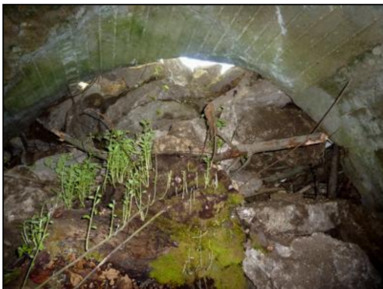
La sortie presque comblée vue de l'intérieur