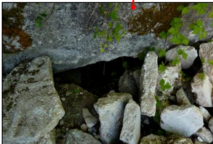
L'actuel orifice de sortie sous le fronton (flèche)

Quelqu'un a pris mon derrière. Qui prendra mon visage ?