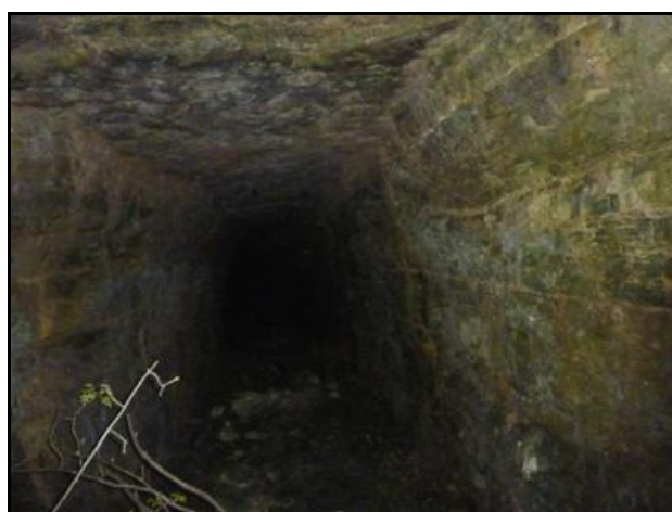
Ci-dessus et ci-dessous, la galerie en roche brute telle qu'elle apparaît encore aujourd'hui