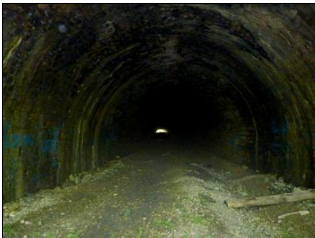
La belle galerie du tunnel Au fond, la tentative d'obstruction proche de la sortie

Si cette fiche comporte des erreurs ou des oublis, merci de nous le signaler.