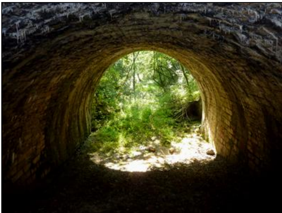
La sortie vue depuis le sommet de la tentative d'obstruction