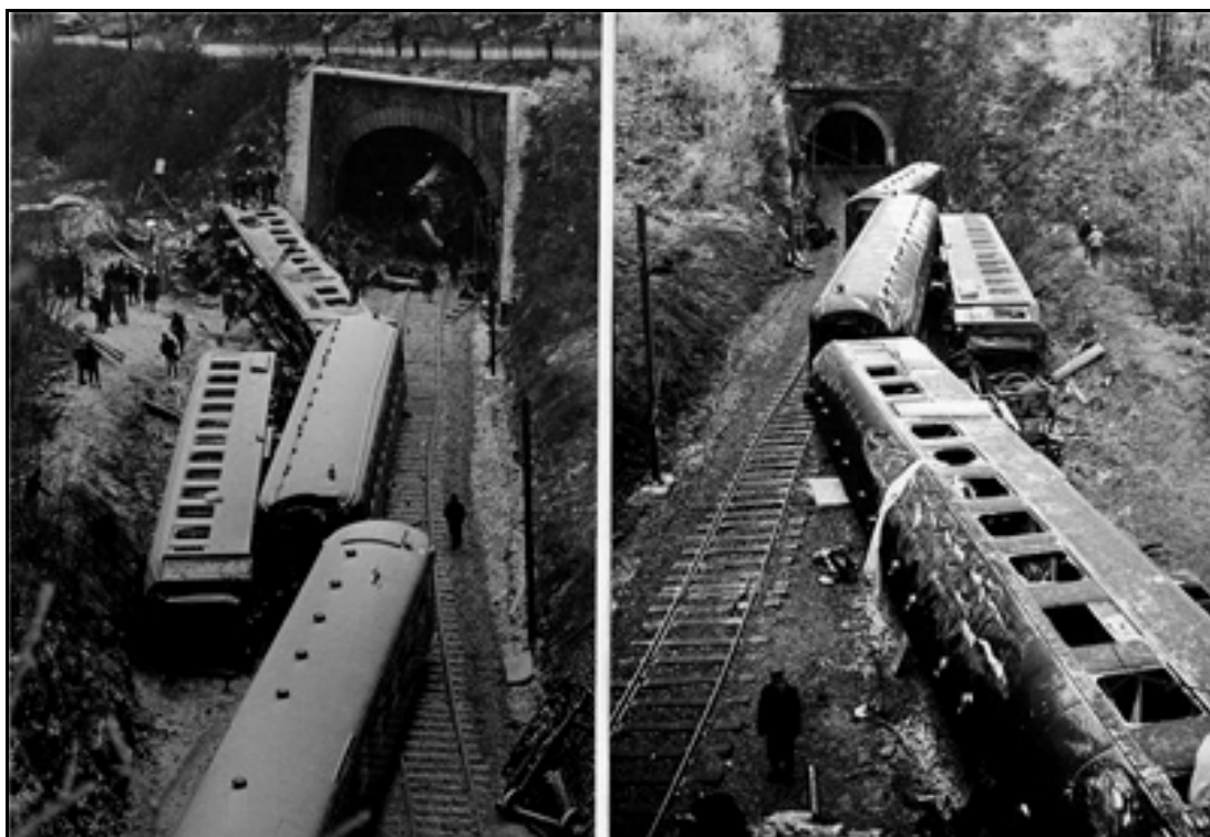
La queue du train déraillé entre les tunnels des Ecomboles 2 (à gauche) et du Cul de Brey 1 (à droite) La photo de gauche est prise dans le sens de circulation du train

On devine l'arrière de la 4 e voiture voyageurs très abîmée dans l'entrée du tunnel des Ecomboles La photo de droite est prise vers l'arrière du train et le tunnel du Cul de Brey n° 1 dont il venait de sortir