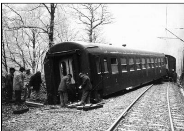
La 2 e voiture sans son boggie arrière

A l'entrée du tunnel, la voie se dérobe sous la deuxième voiture voyageurs (3 e véhicule du train) dont le boggie arrière est arraché. Sous l'élan, le train continue cependant sa route, la troisième voiture voyageur se met en travers du souterrain et la quatrième voiture se couche tandis que son arrière est complètement broyé par la voiture suivante.