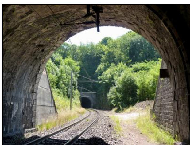
Le lieu de l'accident de janvier 1968 et l'entrée du tunnel du Cul de Brey 1 au fond

Si cette fiche comporte des erreurs ou des oublis, merci de nous le signaler.