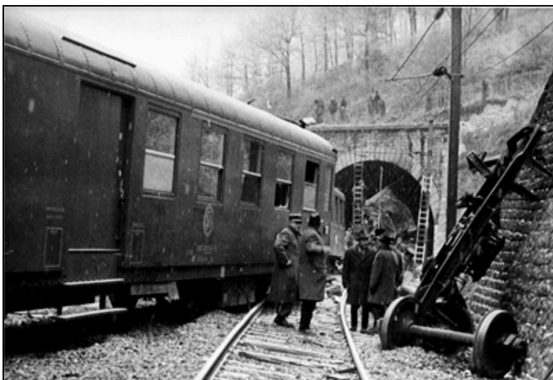
Au premier plan, la dernière voiture du train A l'arrière plan, l'entrée du tunnel des Ecomboles n° 2 dans le sens de circulation du train

On devine l'arrière de la 4 e voiture voyageurs très abîmée dans l'entrée du tunnel des Ecomboles La photo de droite est prise vers l'arrière du train et le tunnel du Cul de Brey n° 1 dont il venait de sortir