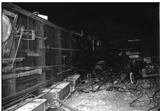
La quatrième voiture couché dans le tunnel et dont l'arrière est complètement broyé