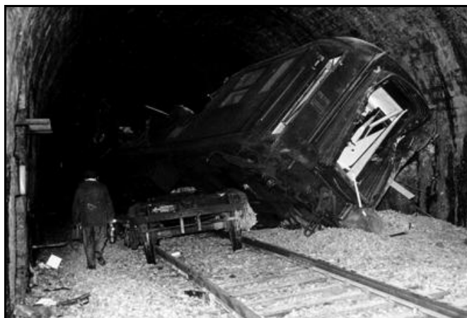
La 3 e voiture en travers du tunnel