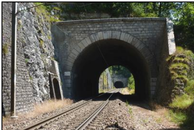
Au fond, le tunnel du Cul de Brey 3