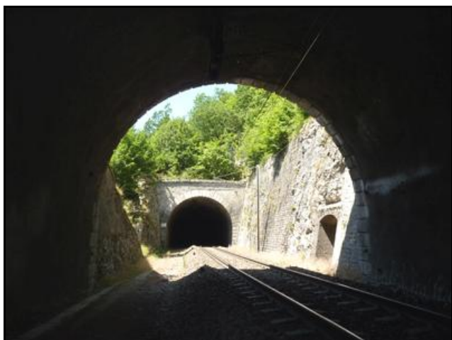
A l'arrière-plan, le tunnel du Cul de Brey 1