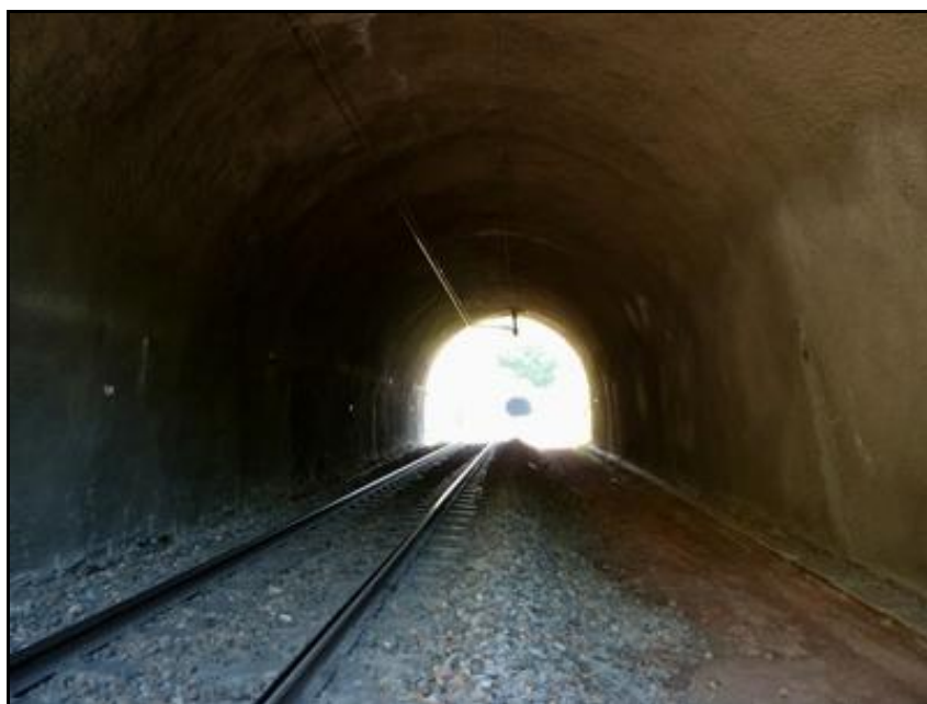
La galerie en regardant vers la sortie avec, au fond, le tunnel du Cul de Brey 3