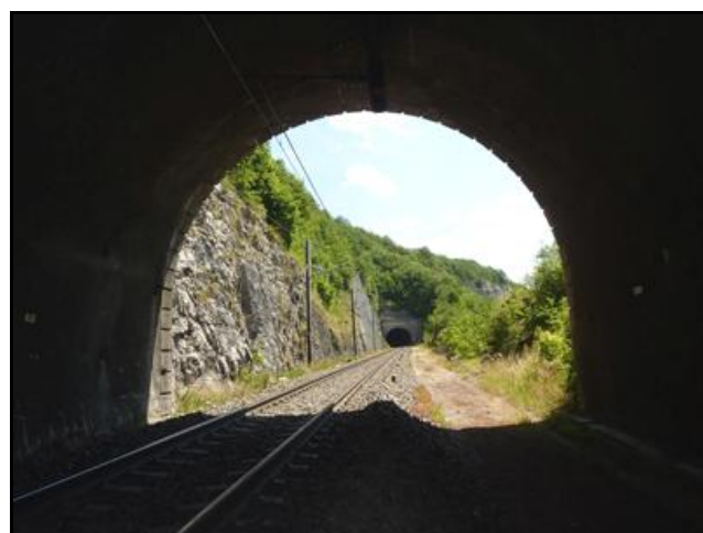
Au fond, le tunnel du Cul de Brey 3