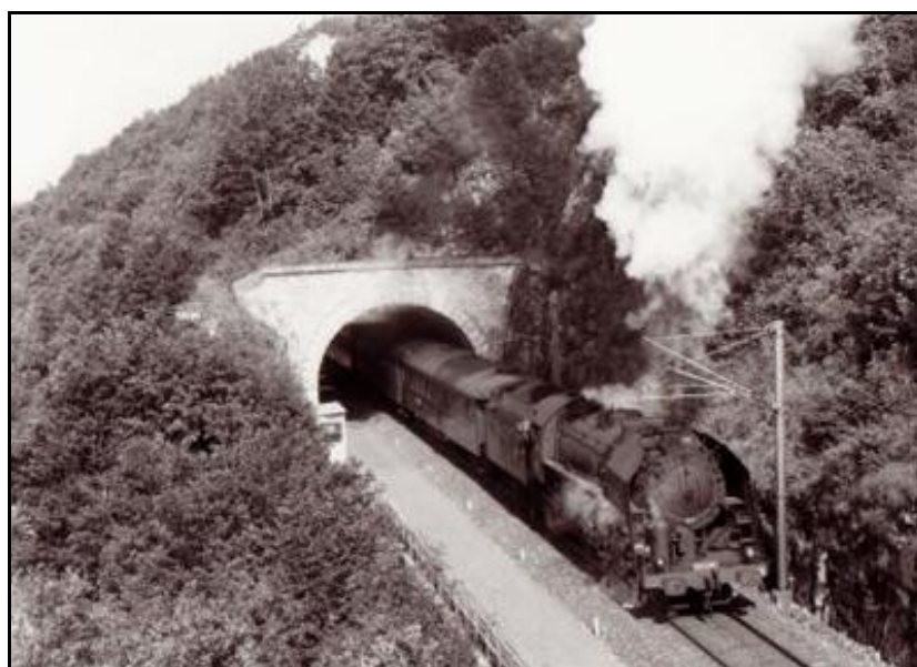
Ci-dessus et ci-dessous, la sortie du tunnel à deux époques différentes