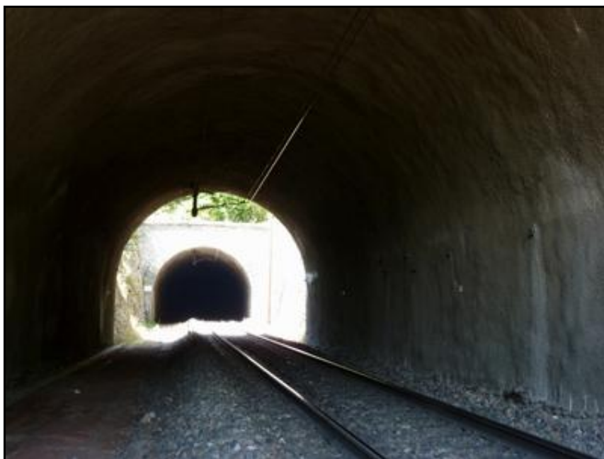
La galerie en regardant vers l'entrée avec, à l'arrière-plan, le tunnel du Cul de Brey 1