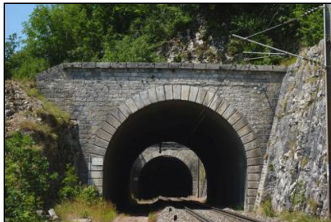
A l'arrière-plan, la sortie du tunnel du Cul de Brey 1