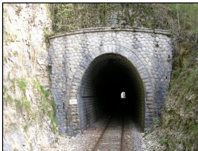
L'entrée et la sortie du tunnel dans leur état initial