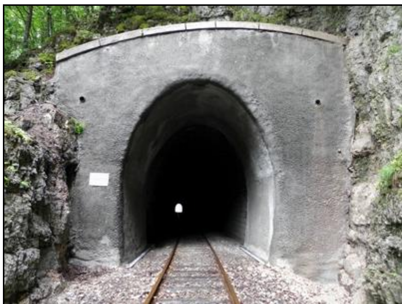
L'entrée du tunnel après campagne de réfection