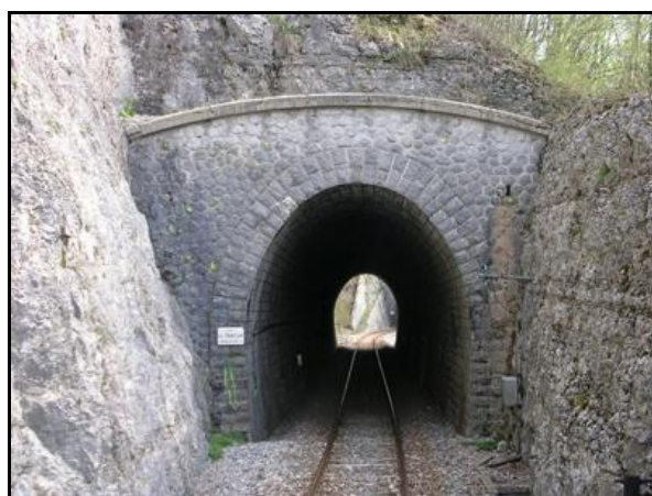
L'entrée et la sortie du tunnel dans leur état initial