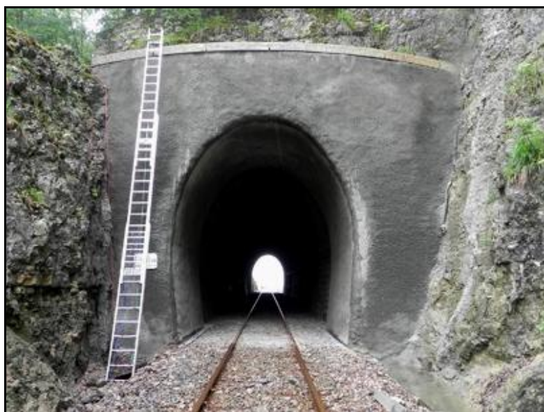
L'entrée du tunnel après campagne de réfection