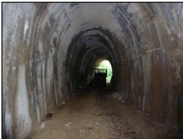
L'entrée de la galerie qui sert à entreposer du vieux matériel agricole