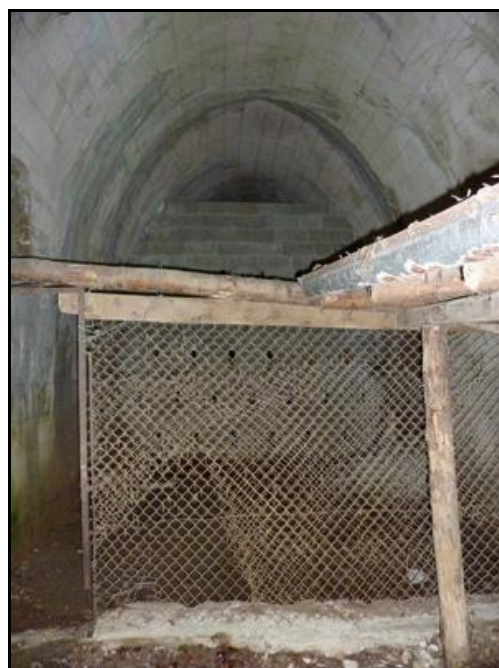
Le mur ajouré qui sépare la galerie de la sortie et du poulailler

Si cette fiche comporte des erreurs ou des oublis, merci de nous le signaler.