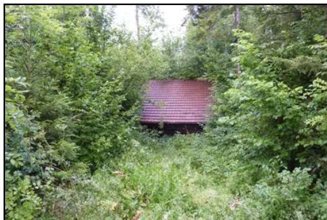
La sortie cachée derrière l'auvent du poulailler