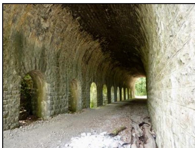
Ci-dessus et ci-dessous, trois vues de l'intérieur de la galerie