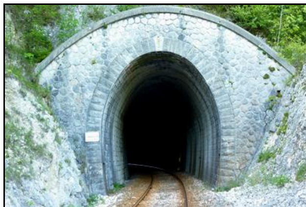
L'entrée et la sortie du tunnel dans leur état initial