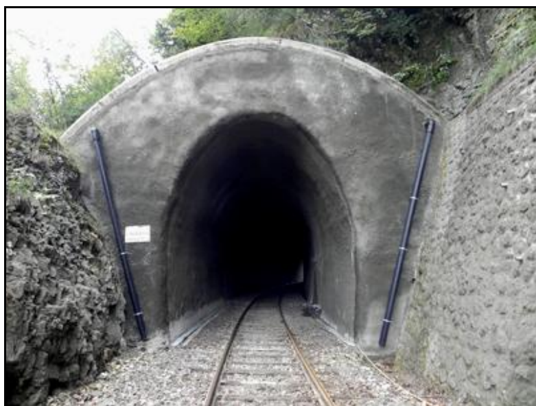
L'entrée après campagne de réfection