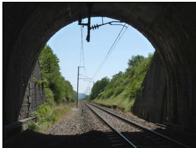
L'entrée et la sortie du tunnel photographiées depuis l'intérieur de la galerie

Si cette fiche comporte des erreurs ou des oublis, merci de nous le signaler.