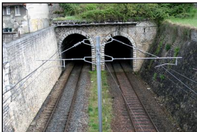
Le tunnel de Montrichard Sud 1 est ici à droite