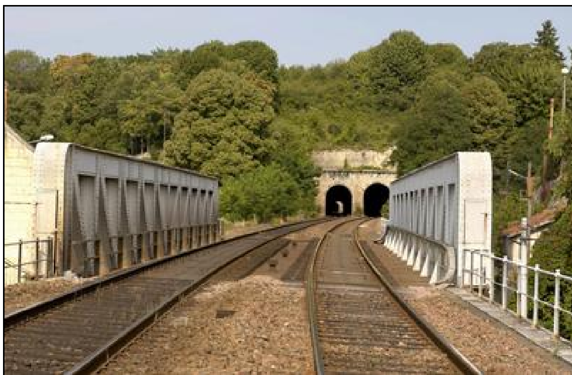
Les sorties des deux tunnels de Montrichard 1 A gauche, le tunnel Sud ; et à droite, le tunnel Nord