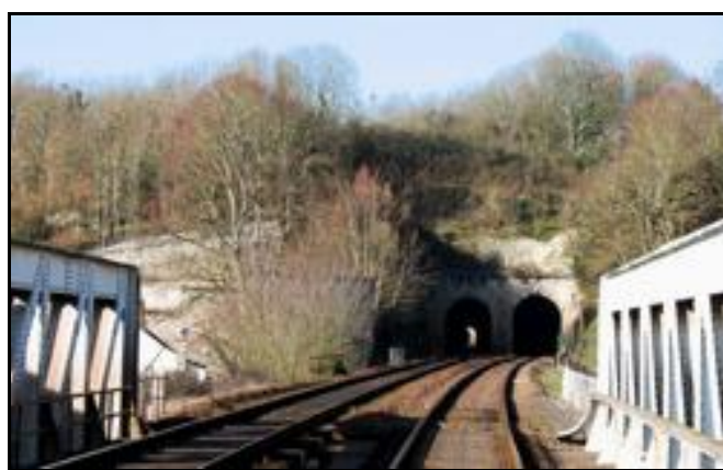
Le tunnel de Montrichard Sud 1 correspond à la voie en service

Si cette fiche comporte des erreurs ou des oublis, merci de nous le signaler.