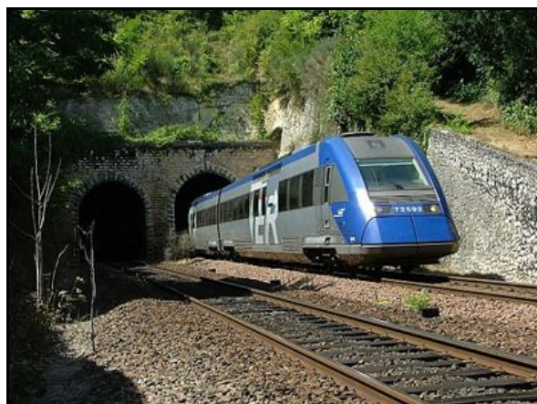
Le tunnel Montrichard Sud 1 est ici à gauche