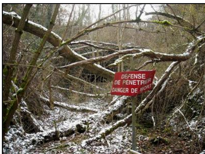
Cette photo montre bien les difficultés d'accès à l'entrée