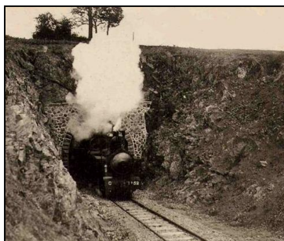
La sortie, du temps du petit train

Si cette fiche comporte des erreurs ou des oublis, merci de nous le signaler.