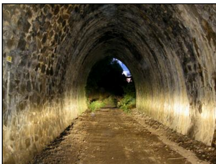
La sortie du tunnel, prise de l'intérieur

Si cette fiche comporte des erreurs ou des oublis, merci de nous le signaler.