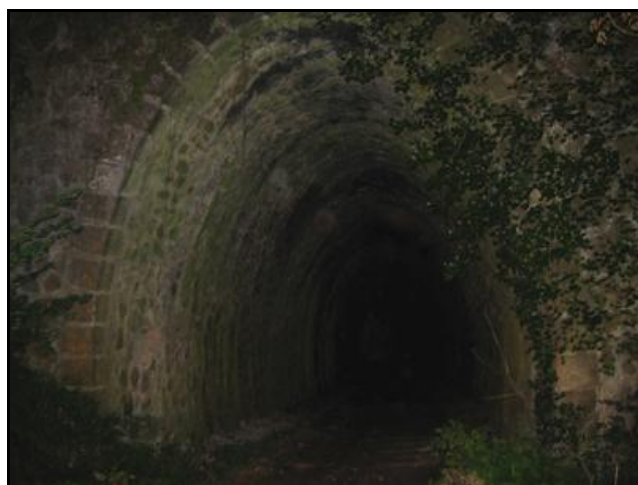
L'entrée et la sortie vues lors d'une visite de nuit