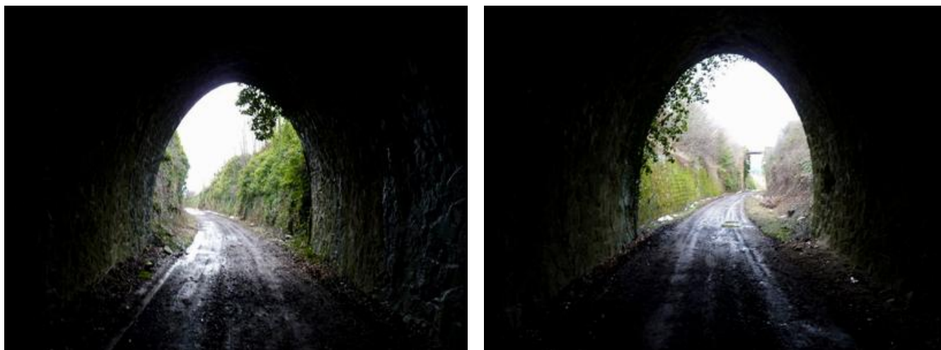
L'entrée et la sortie vues depuis la galerie