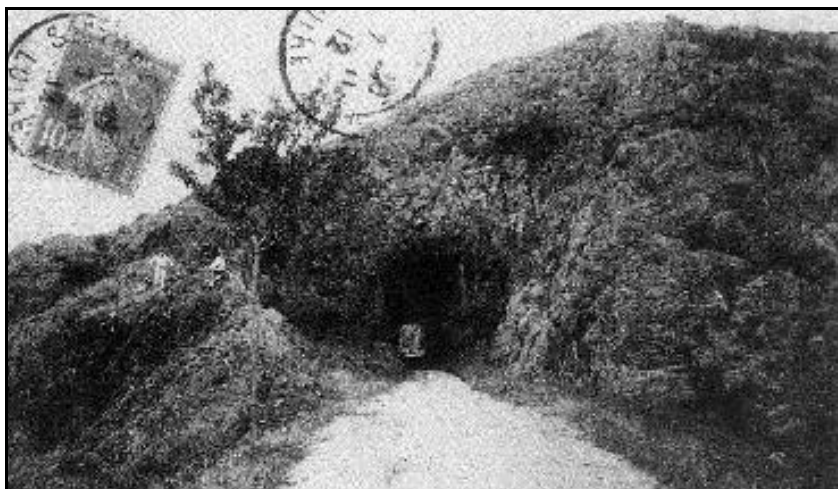
Sortie du tunnel de la Carrière On entraperçoit à l'arrière-plan la sortie du tunnel des Allemands

Si cette fiche comporte des erreurs ou des oublis, merci de nous le signaler.