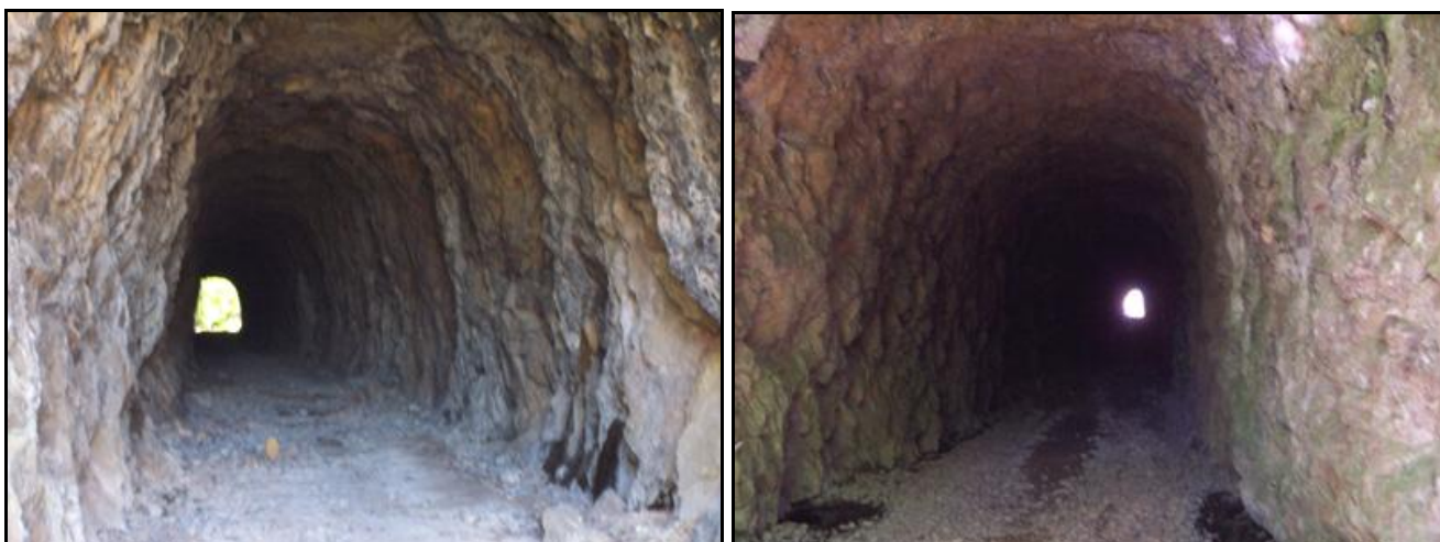
Ci-dessus et ci-dessous, trois aspects de la galerie