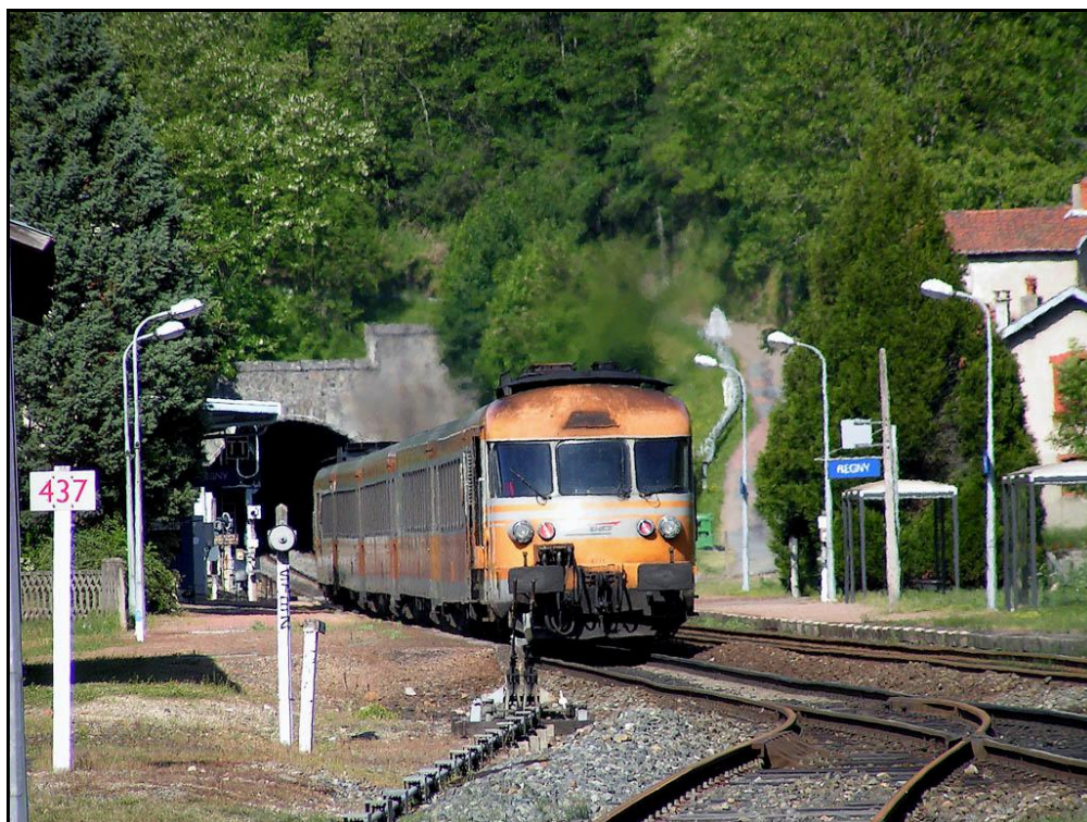
Un turbotrain quitte la gare de Réigny et s'apprête à rentrer dans le tunnel

Si cette fiche comporte des erreurs ou des oublis, merci de nous le signaler.