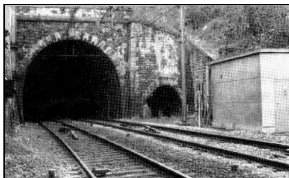
Le nouveau tunnel et le vieux tunnel de Couzon