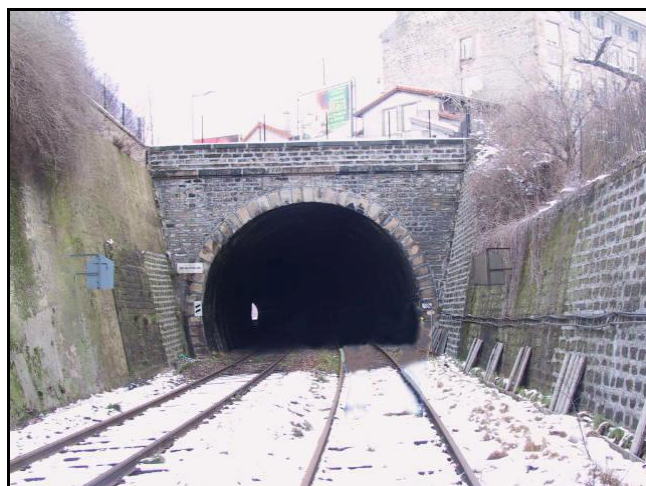
Le faux tunnel de Beaubrun avant électrification de la ligne

Si cette fiche comporte des erreurs ou des oublis, merci de nous le signaler.