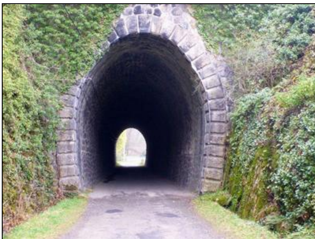
Gros plan sur la belle galerie de ce petit tunnel

Si cette fiche comporte des erreurs ou des oublis, merci de nous le signaler.