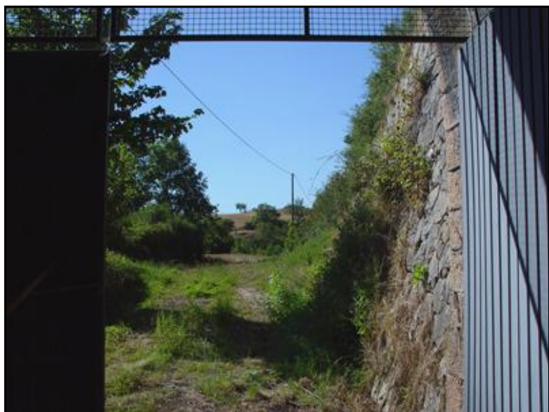
L'entrée du tunnel vue de l'intérieur