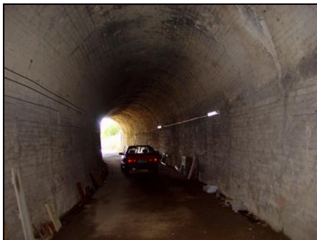
Ci-dessus et ci-dessous, quatre vues de la galerie transformée en entrepôt communal pour stocker divers matériels plus ou moins modernes