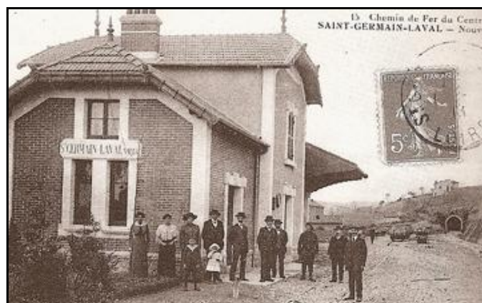
L'entrée et la sortie du tunnel, du temps où la ligne était en service

Si cette fiche comporte des erreurs ou des oublis, merci de nous le signaler.