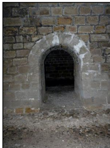
La galerie 2 abandonnée et la niche de communication entre les souterrains

Si cette fiche comporte des erreurs ou des oublis, merci de nous le signaler.