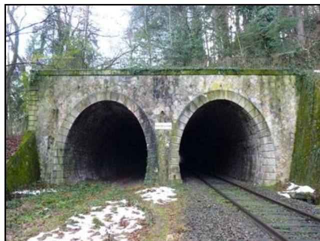
La galerie du Bois de Rive 2 est le tunnel abandonné