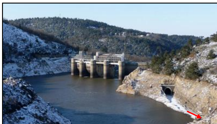
La sortie du tunnel et l'entrée du tunnel d'Essalois qui lui fait suite ( flèche rouge )

Noter que l'eau du lac commence à dissoudre les joints du parement de voûte