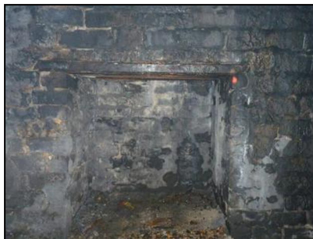
Autres vues de la galerie avec une niche

Si cette fiche comporte des erreurs ou des oublis, merci de nous le signaler.