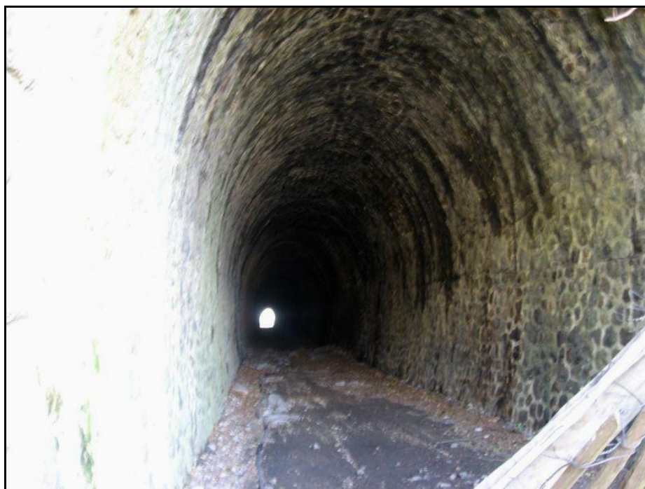
Ci-dessus et ci-dessous, trois aspects de la galerie