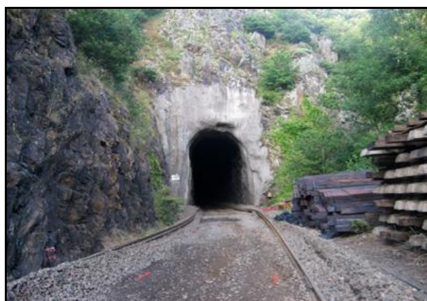
Photo prise pendant des travaux de changement de voie

Si cette fiche comporte des erreurs ou des oublis, merci de nous le signaler.