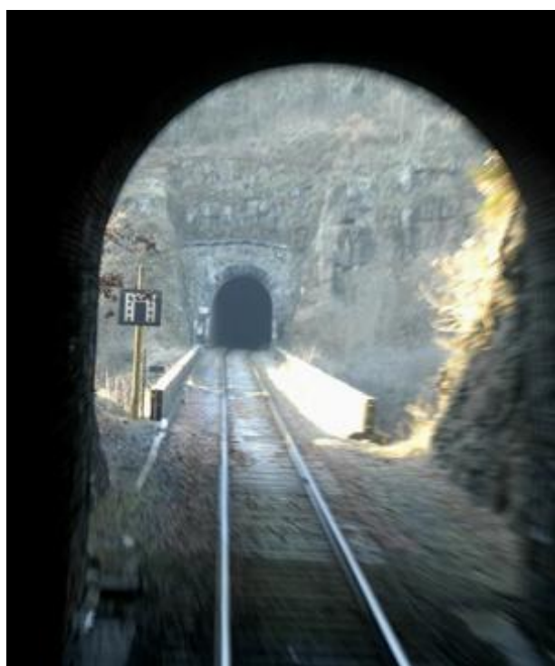
L'entrée du tunnel de Chambezon prise depuis la sortie du tunnel de Planzol

Si cette fiche comporte des erreurs ou des oublis, merci de nous le signaler.