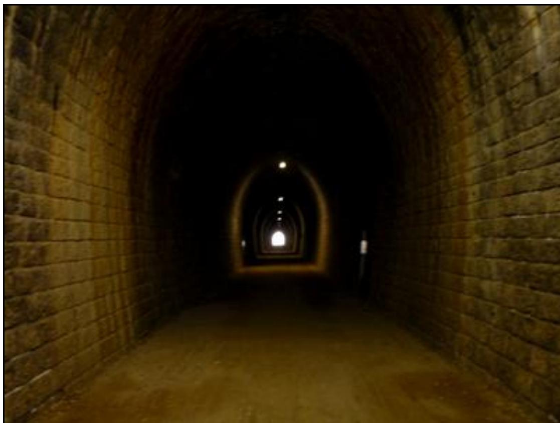
L'intérieur de la galerie aujourd'hui