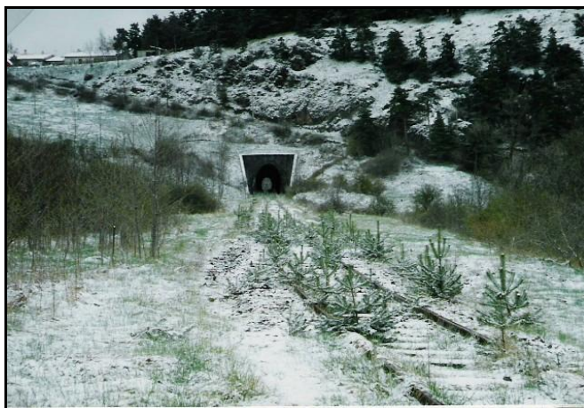
L'entrée du tunnel du temps des travaux et la sortie après abandon mais avant retrait des rails